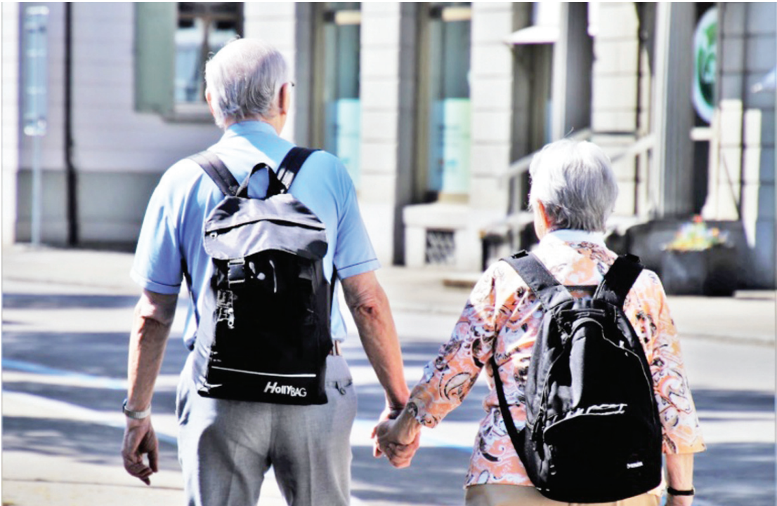
Programa Estadual São Paulo Amigo do Idoso

Muito mais do que desbravar as riquezas naturais e a fauna de um país, os “Safaris” têm potencializado e diversificado as oportunidades do turismo ao redor do mundo. No Brasil, ao contrário do que muitos imaginam, também é possível desfrutar dessa aventura em diversos segmentos. Como é o caso do Parque Estadual do Jalapão, no Tocantins, e o Safari Gastronômico com base no turismo de base comunitária, em Roraima. E o ponto de partida é o Pantanal! Fazendas que misturam a pecuária com o ecoturismo têm ofertado espaços com este tipo de passeio no Brasil. Um exemplo disso é o Refúgio Ecológico Caiman/Onçafari. A iniciativa, através da habituação de onças-pintadas, facilitou a observação dos animais pelos turistas. Localizada na zona rural de Miranda (MS), oferece ainda hospedagens e conexão com a natureza. Outra opção é a Fazenda San Francisco, também situada na cidade sul-mato-grossense, que aceita hóspedes do mundo todo, tanto para pernovernar quanto para apenas passarem o dia em suas dependências.