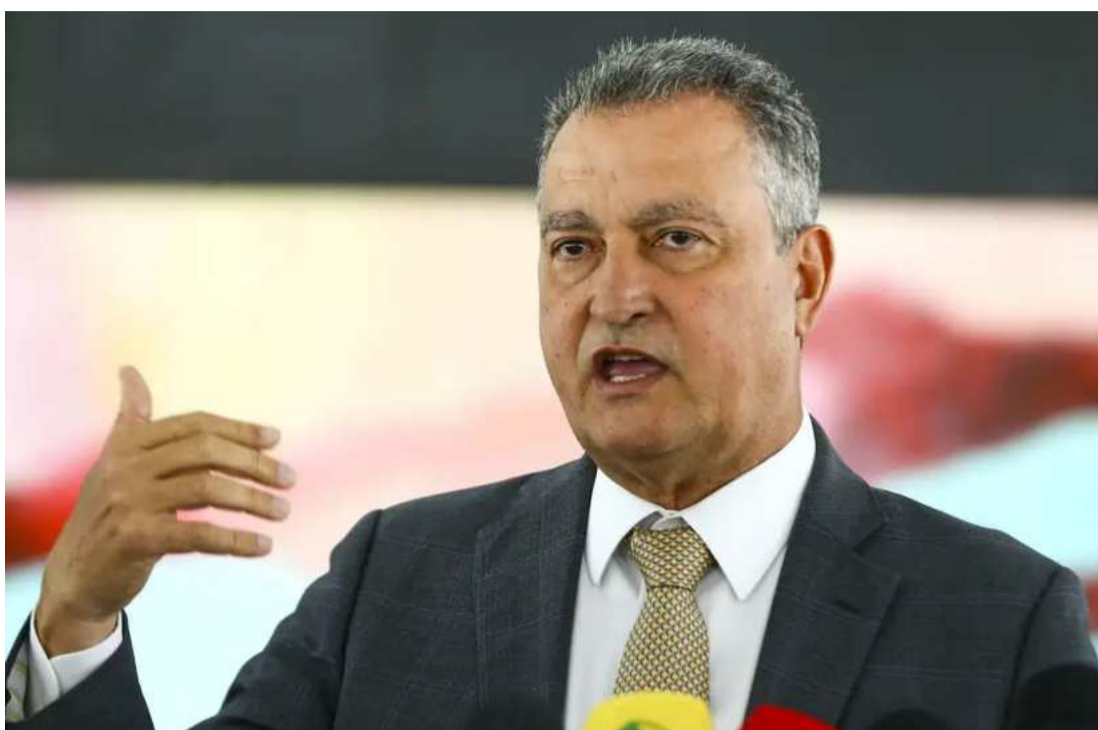
Costa foi questionado se estaria mantido o acordo sobre a recomposição de R$ 3,6 bilhões em emendas, dos quais 2/3 iriam para a Câmara e 1/3 para o Senado.

Inicialmente, a Lei de Diretrizes Orçamentárias (LDO) previa R$ 11 bilhões de emendas. No entanto, o Congresso aprovou, posteriormente, mais R$ 5,6 bilhões, que foram vetados pelo presidente da República. Agora, o Planalto e o Congresso dialogam para recompor R$ 3,6 bilhões dessa verba que