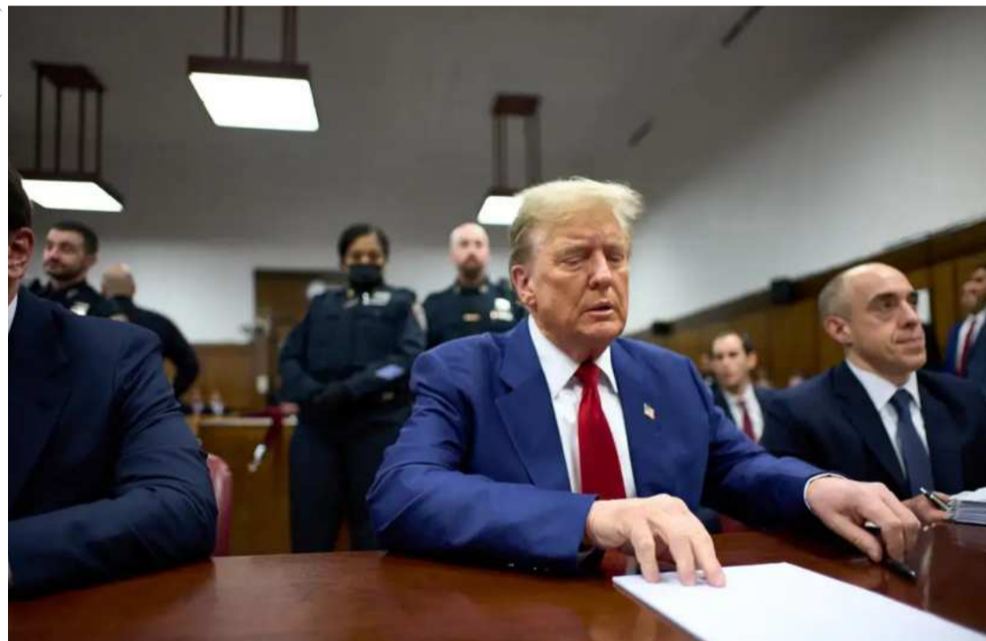
Trump foi condenado por desacato ao tribunal ontem (30) e multado em US$ 9.000 por violar repetidamente uma ordem de silêncio que o impedia de fazer declarações públicas sobre testemunhas, jurados e outras pessoas ligadas ao caso de suborno.

Um juiz de Nova York advertiu o ex-presidente americano Donald Trump que ele