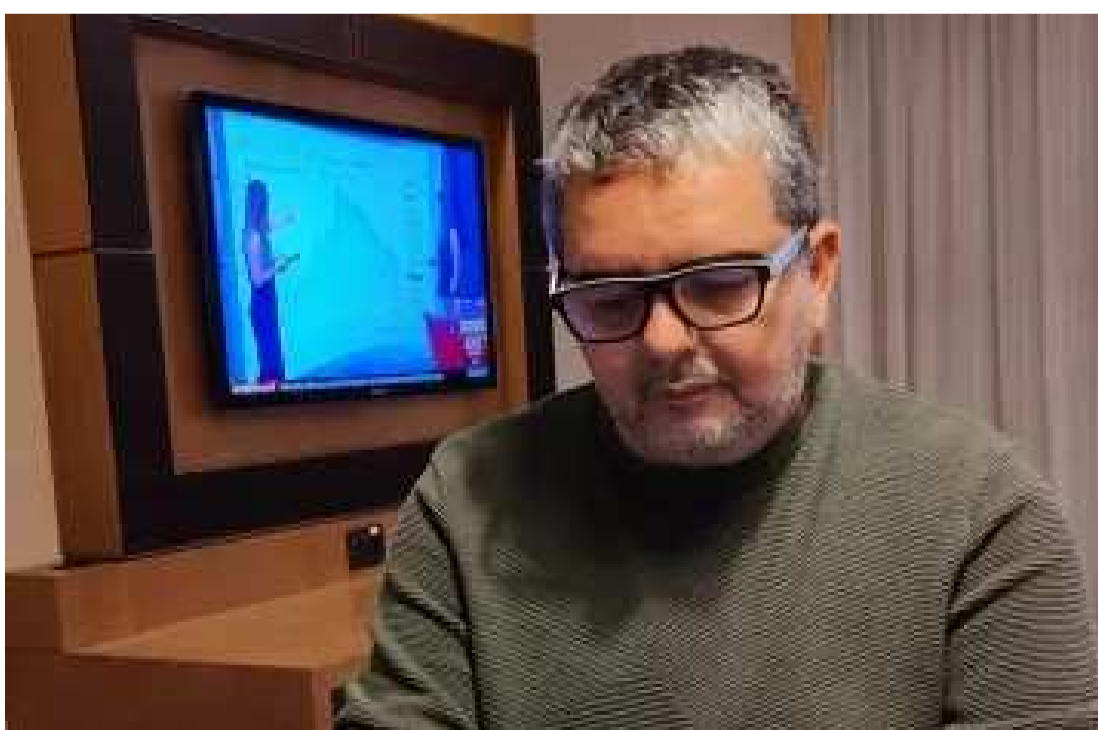
Afirmção foi feita pelo ministro do Trabalho e Emprego, Luiz Marinho.