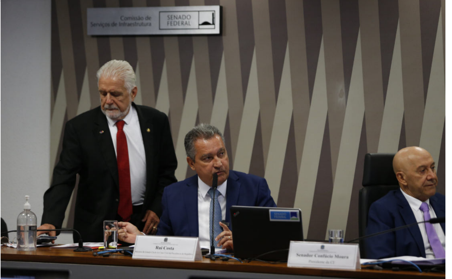
O ministro da Casa Civil, Rui Costa, participou de audiência pública na Comissão de Infraestrutura do Senado para falar sobre o novo Programa de Aceleração do Crescimento (PAC), no Congresso, na manhã de ontem, 30. A audiência foi presidida pelo senador Confúcio Moura (MDB-RO), com a participação do senador Jaques Wagner (PT-BA), que é líder do governo no Senado.