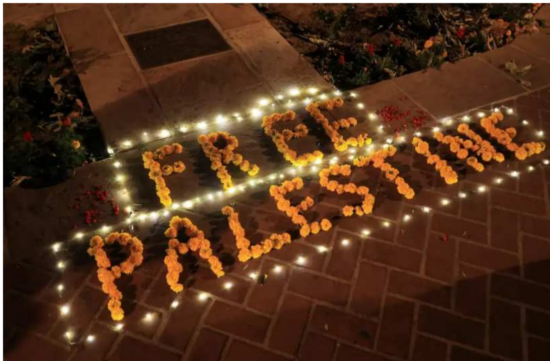
Os estudantes protestam contra as baixas civis na guerra. Alguns deles, no entanto, entoaram cânticos antisemitas e hostilizaram alunos e professores judeus.

A estação de rádio estudantil, WKCR-FM, transmitiu a tomada do salão - que ocorreu quase 12 horas após o prazo final de segunda-feira, às 14h, para que os manifestantes deixassem o acampamento de cerca de 120 barracas ou fossem suspensos. Os representantes da universidade não responderam imediatamente aos e-mails solicitando