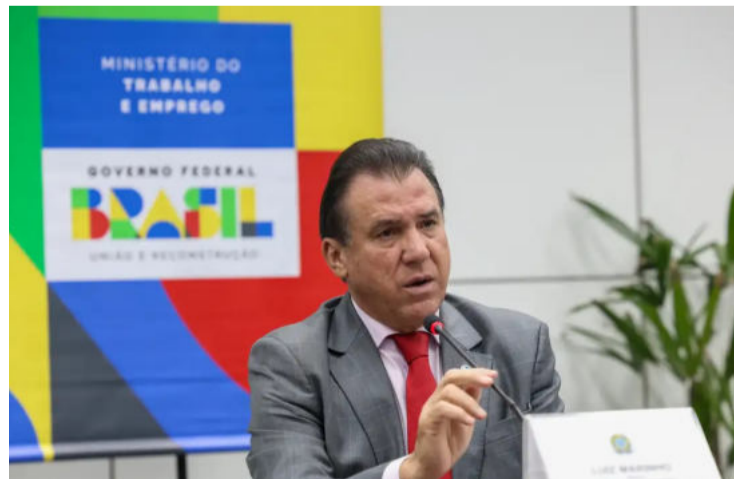
Marinho comentou decisão da Justiça Federal que liberou alguns segmentos, como farmácias e universidades, de divulgarem as informações de transparência salarial e de critérios remuneratórios previstas na regulamentação da Lei da Igualdade Salarial.

Toda a empresa que omitir dados sobre igualdade salarial entre os gêneros serão fiscalizadas, prometeu ontem, 30, o ministro do Trabalho e Emprego, Luiz Marinho, durante coletiva de