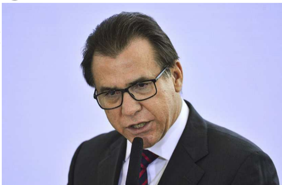
Afirmção foi feita pelo ministro do Trabalho e Emprego, Luiz Marinho

O ministro do Trabalho e Emprego, Luiz Marinho, afirmou, ontem (30), que as empresas que omitem dados sobre igualdade salarial terão “um olhar especializado” do área de fiscalização da pasta. “Se querem atenção, terão uma atenção”, disse, durante coletiva de imprensa para apresentar dados do Cadastro Geral de Empre-