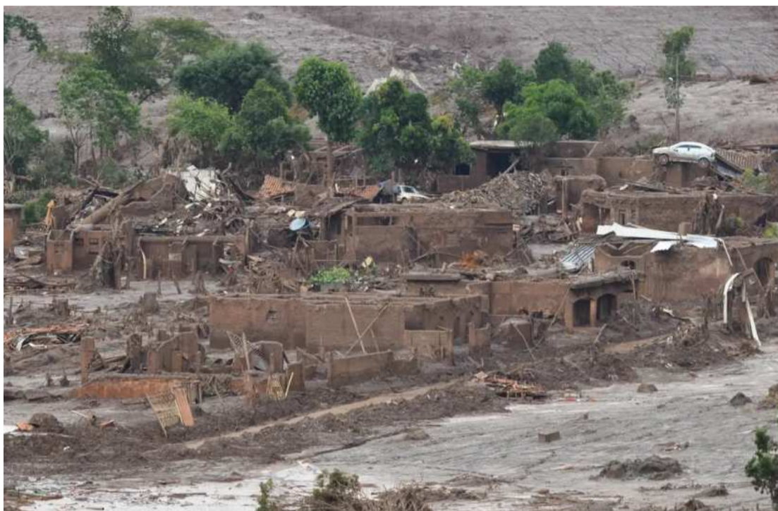
Negociações para uma repactuação do acordo de reparação dos danos se arrastam há mais de dois anos.

A tragédia ocorreu em 5 de novembro de 2015, quando cerca de 39 milhões de metros cúbicos de rejeito escoaram pela Bacia do Rio Doce. Dezenove pessoas morreram e houve impactos às populações de dezenas de municípios até a foz no Espírito Santo. Negociações para uma repactuação do acordo de reparação dos danos se arrastam há mais de dois anos. As tratativas buscam solução para diversos problemas até hoje não solucionados. Passados mais de oito anos do episódio, tramitam no Judiciário brasileiro mais de 85 mil processos entre ações civis públicas, ações coletivas e individuais. Além das mineradoras, a mesa de negociação é composta pelo governo federal, pelos governos de Minas Gerais e do Espírito Santo, pelo Ministério Público Federal (MPF) e pela Defensoria Pública da União, além dos ministérios públicos e das defensorias públicas dos dois estados atingidos. Até o fim